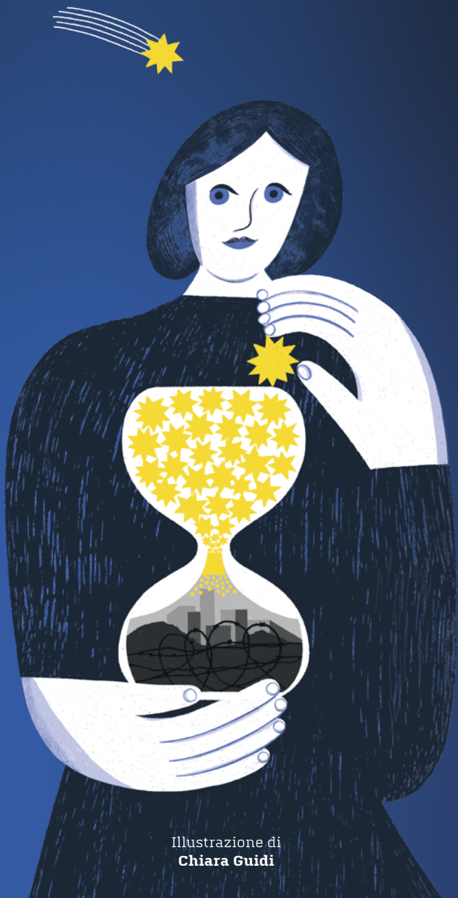
Illustrazione di Chiara Guidi